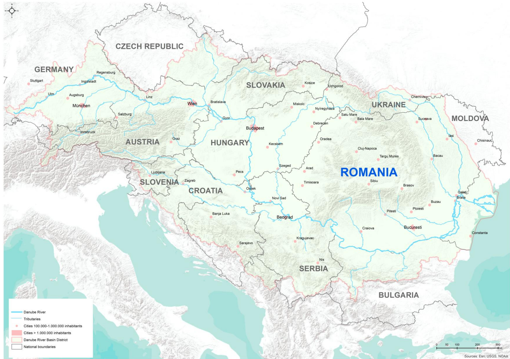
Figura 1.2. Districtul Hidrografic al Fluviului Dunăre